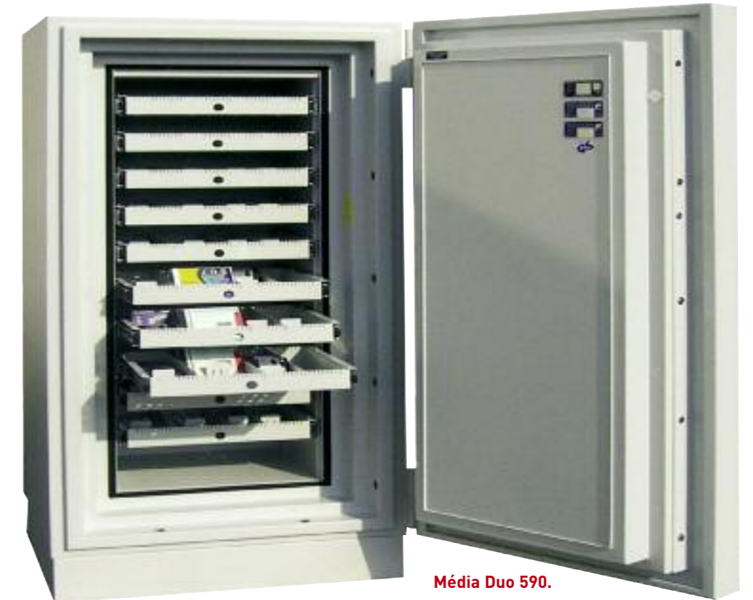
Média Duo 590.

➔ Lors d'un incendie le joint se dilate de 10 fois son volume pour assurer une parfaite étanchéité aux flammes, au gaz, à l'aspersion et à la chaleur.