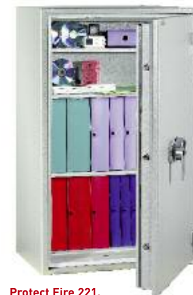
Protect Fire 221. Avec 3 tablettes réglables sur crémaillères au pas de 40 mm.

Fabrication Nouvelles Technologies Baisse de poids de 30%