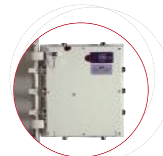
Verrouillage de la porte sur les 4 côtés par pènes tournants actifs/passifs chromés, nickelés, anti-sciage. Angle d'ouverture porte 200°.

Fabrication Nouvelles Technologies Baisse de poids de 30%