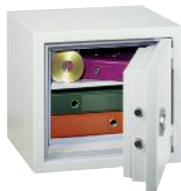
Protect Fire 50. Équipement standard, 1 tablette réglable sur crémaillères au pas de 40 mm.