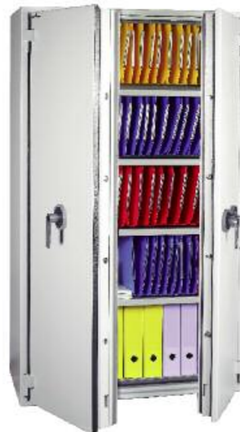
Protect Fire 710. Avec 4 tablettes pour dossiers suspendus réglables en hauteur + 1 rail d'accrochage dans le haut (5 niveaux de dossiers suspendus au total).

Les armoires ignifuges Protect Fire sont homologuées norme Européenne EN 1047.1, S60P. Détail du test page 4.