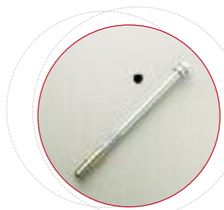
Trou de scellement à la base ø 14 mm.