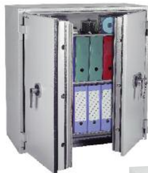
Protect Fire 246. Avec 2 tablettes réglables sur crémaillères au pas de 40 mm.